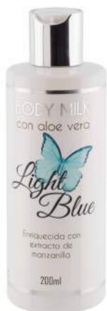
Ref. CP09.200 Light Blue