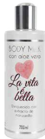
Ref. CP12.200 La vita è bella