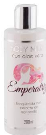
Ref. CP16.200 Emperatriz