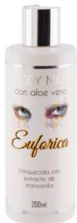
Ref. CP10.200 Euforica