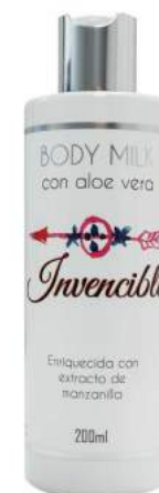
Ref. CP13.200 Invencible