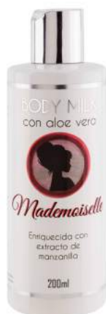
Ref. CP15.200 Mademoiselle