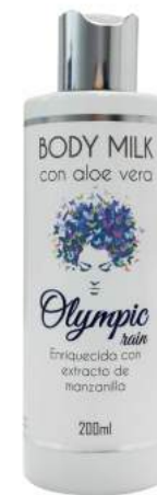
Ref. CP18.200 Olympic Rain

Crema corporal ligera y de rápida absorción que hidrata la piel dejándola suave y perfumada. Su textura aterciopelada y ligera facilita su aplicación.