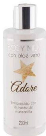
Ref. CP14.200 Adore.