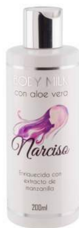
Ref. CP11.200 Narciso